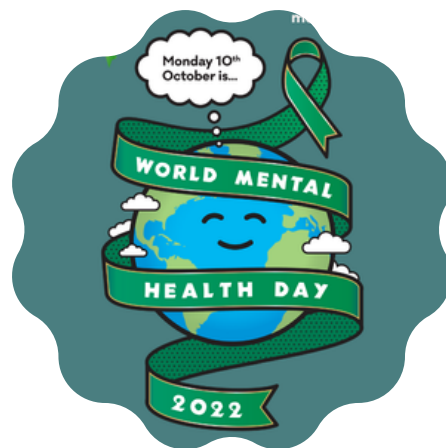
World Mental Health Day 2022 posters and social graphics. (n.d.), Mental Health Foundation. https://www.mentalhealth.org.uk/our-work/public-engagement/world-mental-health-day/posters-and-social-graphics

Ngayong taon, nag-organisa ang Integrated School Guidance and Counseling Center ng isang webinar na may pamagat na “Befriending my Emotions”. Bukod rito, hinimok din ang mga mag-aaral na magsuot ng kulay asul na pananamit sa mismong araw ng pagdiriwang.